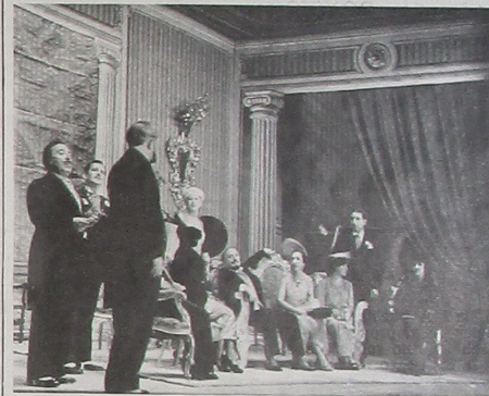
«Gente bien»: Rusiñol, edición de lujo

En la actual ocasión, el Windsor fue el espléndido marco para el «Festival del Sainete catalán». En ella se representaron, magníficamente, tres obras de distinto carácter: «La teta gallinera», de Camprodon, llena de un sentimentalismo rural muy del gusto de la época;