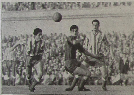
Final de Copa 1957; la victoria y la pelota en el aire. Al fin el Barcelona y Gensana vencieron

Este año, mejor dicho, a primeros del año venidero, como leridanos, aspiramos a ver a Gensana entre los finalistas. Para ello nos basamos en la excelente y meteórica carrera futbolística