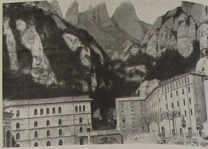
Montserrat: nuevamente punto de concentración de los sardanistas leridanos.

La «escolla» sardanista «Santiago Rusiñol», junto con un nutrido grupo de seguidores, se trasladó a Montserrat para sumarse a la fiesta; la mayoría de nos-