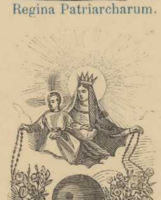
Regina sacratissimi Rosarii.