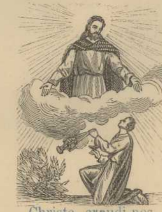
Christe, exaudi nos. R. Christe, etc.