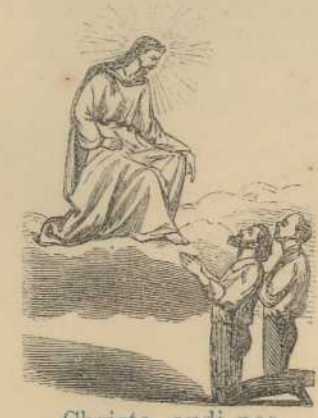
Christe, audi nos. R. Christe, etc.