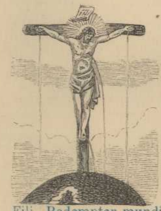
Fili, Redemptor mundi Deus.