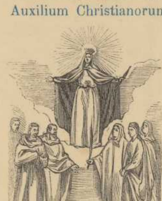
Regina Sanctorum omnium.