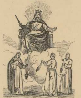
Vas insigne Devotionis.