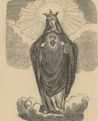
Causa nostrae letitiae.