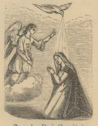
Sancta Dei Genitrix.