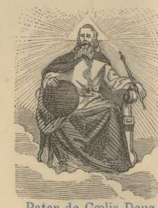
Pater de Coelis Deus, R. Miserere nobis.