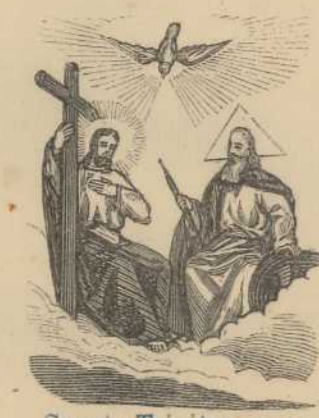
Sancta Trinitas unus Deus.