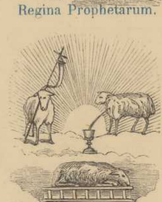
Agnus Dei, qui tollis peccata mundi. etc.etc.