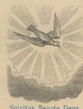
Spiritus Sancte Deus.