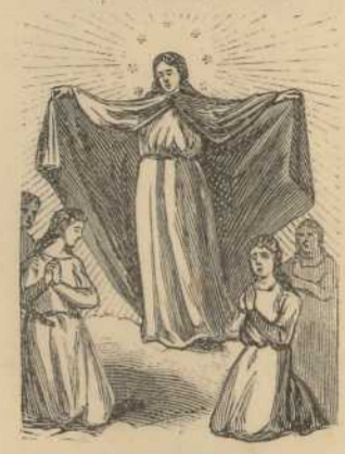
Sta. Virgo Virginum.