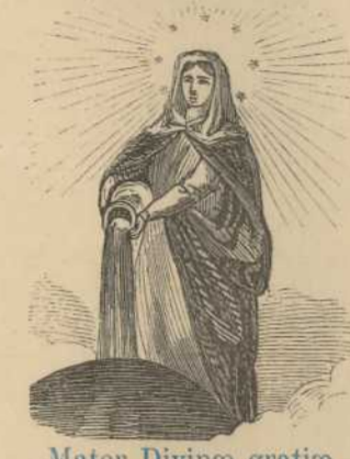
Mater Divinae gratiae.