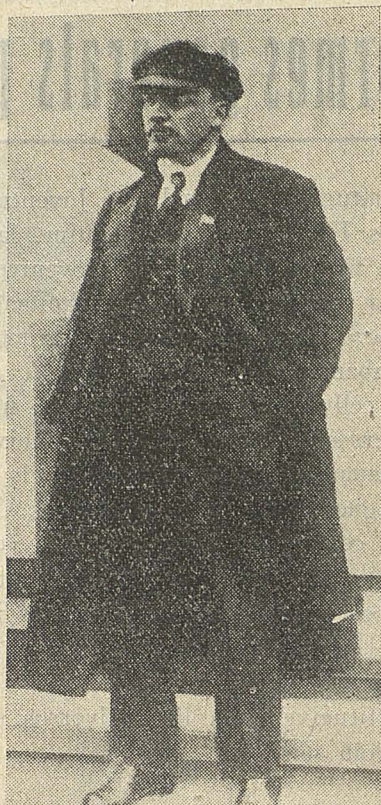
LENIN, nostre mestre, nostre exemple

La lluita contra el feixisme us concedeix aquest lloc d'honor i teniu el deure d'ésser dignes d'ell.