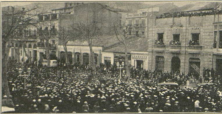
No hi ha màquina capaç de copsar en la seva totalitat l'apoteòsica rebuda feta a Francesc Macià. Amb tot, el fotògraf J. Font ha pogut impressionar aquest fragment de la Rambla de Ferran que dóna, si més no, idea de la imponent manifestació del diumenge.

al nostre problema. Propugnava el front únic d'esquerres per anar a les eleccions, si aquest era el disseny del poble, i obtenir la victòria que indiscutiblement coronaria aquesta unió, per tal de plantejar al Parlament espanyol el nostre problema, i en el cas que aquest refusés donar la solució d'acord a la demanda dels repre. entants de Catalunya, els parlamentaris catalans, es retirarien immediatament del Congrés i a Catalunya seria creada