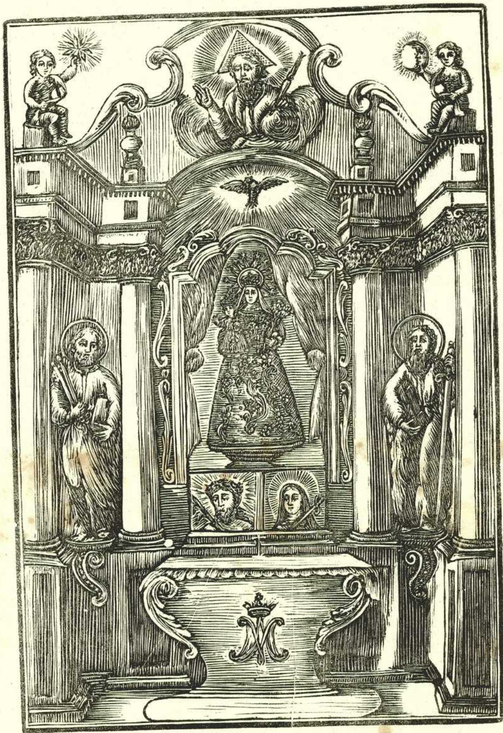
NOSTRA SENYORA DEL REMEY.