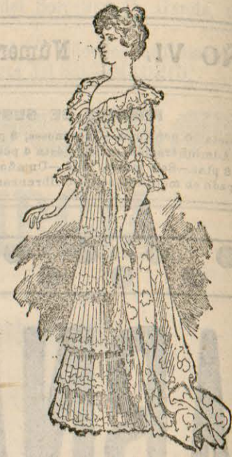
Traje de interior

¿Por qué no hemos de poner en nuestras toilettes de casa tanto ó más esmero que en las de calle, recepción ó teatro? ¿No es más legítimo que tratemos de agradar á los nuestros que al rebano de desconocidos cuyos elogios y cuyas censuras deben dejarnos indiferentes? ¡Cuán grande error comete la señora que guarda todos sus aicalamientos para fuera de su casa y vá en ella despeinada y vestida de cualquier manera! Piensen las que tal hacen que el esposo sin percatarse de ello puede establecer comparaciones, siempre odiosas; y que el cariño conquistado se pierde la mayor parte de las veces por no saberlo conservar su dueño.