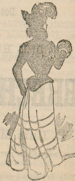
Traje de calle

Se han llevado mucho este verano los trajes Princesa, en crespón de China, rayado con entredoses de chantilly negro ó blanco. Pues bien, puede abrirse uno de estos trajes (que como es sabido figuran una sola pieza con cuerpo y falda) cortando por delante la tela sola, nó el forro. Sobre esa abertura se aplica un delantero de muselina de seda blanca plegada por el estilo del figurín descrite anteriormente. Uniendo los dos bordes del delantero abierto, colócase en el pecho un guión de terciopelo negro drapeado, y con terciopelo igual se hace un cuello alto, que remonte hasta la nuca, y se ponen en los puños unos volantitos: lográndose así, casi sin gasto, una linda deshabillé .