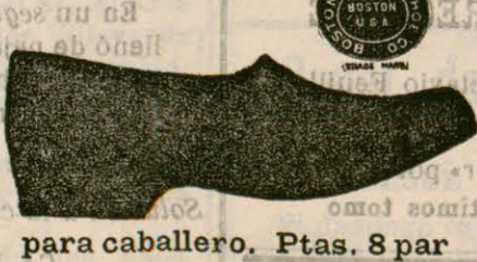
para caballero. Ptas. 8 par