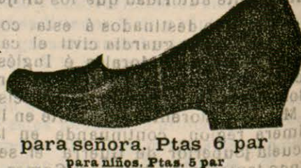
para señora. Ptas 6 par para niños. Ptas. 5 par