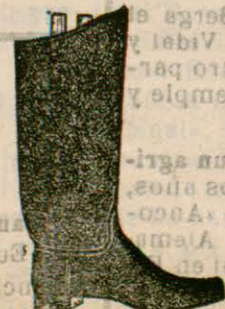
Botas de goma. 25 ptas. par