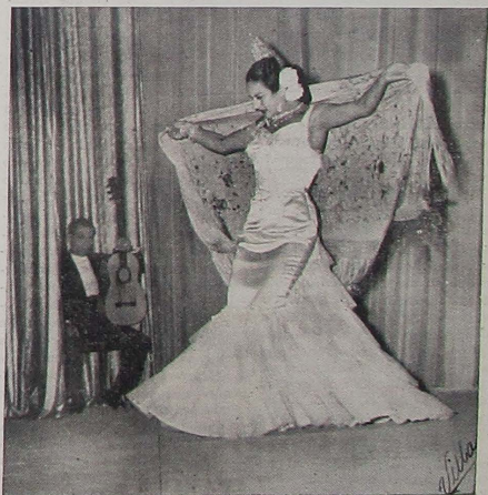
Así de genial es Lola Flores ¡si señor! América ha conocido el temperamento de España, gracias al arte de esta guapa mujer.