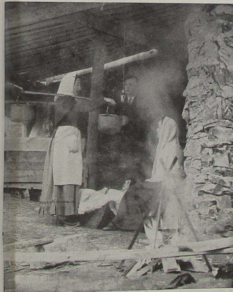
Una mujer, con la "collada a l'espatlla" trae leche para el Niño