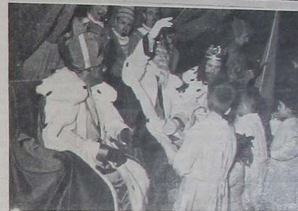
SS. MM. los Reyes Magos de Oriente, entran triunfalmente en Lérida, en lucida cabalgata.

da en dicha plaza, celebrándose solemne misa, y se describió la lápida que le da el nombre actual.