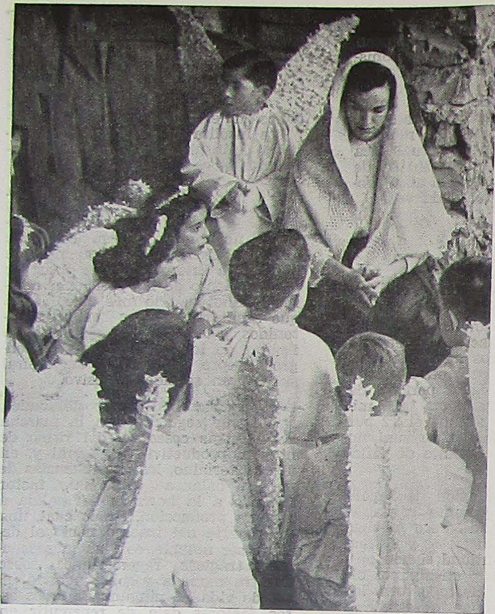
Natividad alborozada en la choza de Engordany. El coro de ángeles rodeando a la Virgen y al Niño Jesús