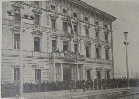
Recepción oficial en el Gobierno Civil, con motivo de la Pascua Militar

UNA PLAZA CAMBIA DE NOMBRE.—Por inercia ha venido conservando su nombre la plaza de Murmuradores, que a partir del domingo último tiene el más apropiado de plaza de la Sagrada Familia. Se bendijo la imagen de la Sagrada Familia en la capilla enclava-