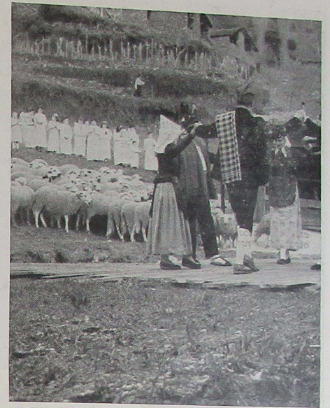
Cánticos y danzas en honor del Niño-Dios. La gente del pueblo forma la típica "anella", enmarcada por los ángeles y por un rebaño de corderos

En resumen, el éxito del "Pessebre vivent de Engordany", se basa en tres grandes elementos de atracción: la fe, el arte y el paisaje.