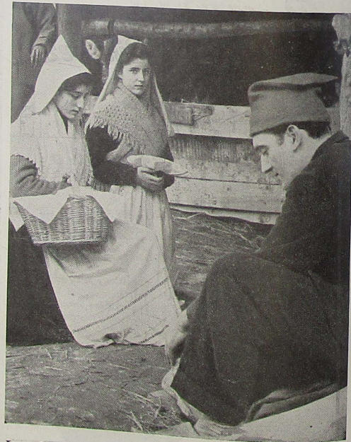
La ofrenda del típico "brossat" y de las "coques masegades"