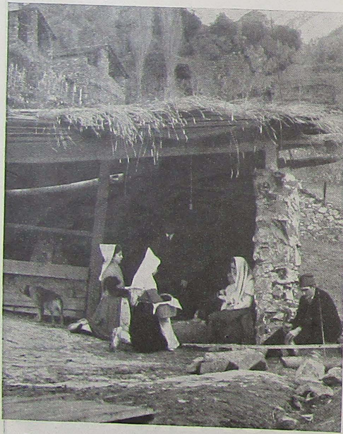
Pastores y doncellas llegan a la choza para adorar al Niño