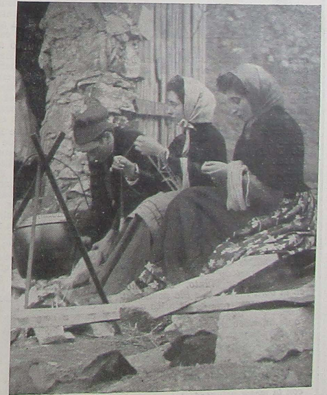
Muchachas y pastores laboran ante la choza de Engordany. Ellas con el "fus", el fabricando "esclops"