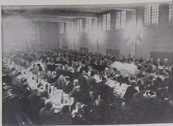
Impresionante aspecto que ofrecía la amplia sala del Frontón Lérida, durante el banquete