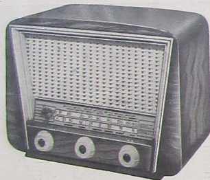
MODELO COMPETIDOR U - 5