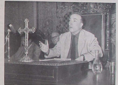
En su magisterio doctrinal del Movimiento clausura el Cursillo de Orientación Juvenil que tuvo lugar en el Palacio de la Pastería.

La información gráfica recogida de números anteriores de LABOR servirá de compendio abreviado que refleje el paso del señor Pagés por el mando civil de la provincia.