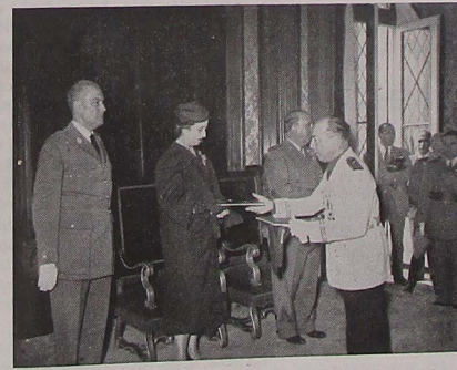
Como autoridad representativa de las tierras leridanas, hace entrega a S. S. E. E. el Jefe del Estado y Señora de unos opúsculos que reflejan la fecundidad de una constante y solicita acción de gobierno en Lérida

Más bien al azar y sin ordenación cronológica se han elegido los hitos fotográficos que dan clara idea de la diversa y constante acción de gobierno ejercida en sus años de mando civil de la provincia.