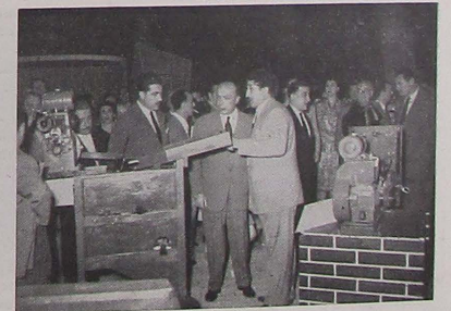
Su presencia en la Feria Agrícola y Ganadera es un testimonio de su cariño y aliento a la actividad y potencia de nuestra capital y provincia.