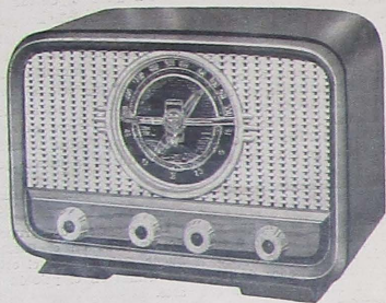
MODELO ROYAL X - 3