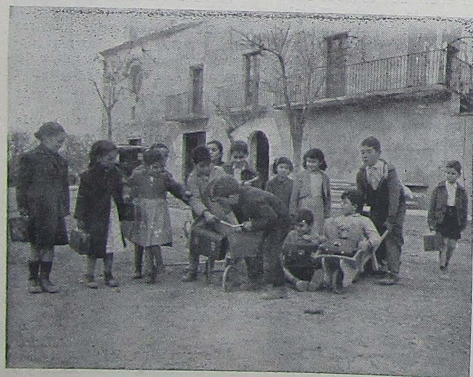
La plaza de la ermita recobra su vida. Al salir de la escuela parroquial los pequeños de las «torres» inician el juego de cada día.

Por lo que se refiere al tendido de la red eléctrica, existe el precedente de la partida de Malgovern, cuyas cuarenta y tres torres disponen de fuerza eléctrica gracias a la gestión conjunta del Ayuntamiento y Comisión de vecinos, y no sería aventurado suponer que la diligencia demostrada por la Junta que orienta las legítimas aspiraciones de la partida de Grenyana, cristalice en un acuerdo parecido y se resuelva este problema cuyo aspecto económico varía notablemente en cada una de las partidas.