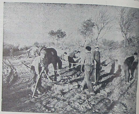
El ensanchamiento del camino se realiza a expensas del terreno de los vecinos, cedido desinteresadamente en beneficio del bien común.

me en una gran extensión de vías urbanas que fueron abiertas a la circulación hace ya varias décadas. El mal es viejo y endémico, y existe una terapéutica sencilla para curarlo, el dinero. Bastaría encadenar proyectos y presupuestos con ritmo accele-