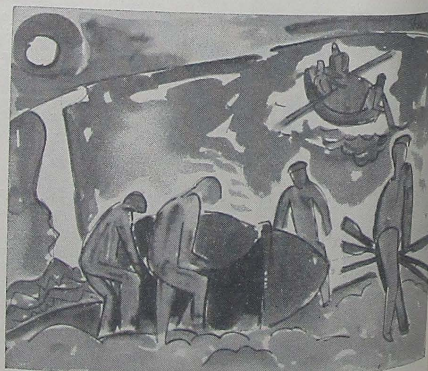
Acuarela de Schmidt-Rottluff

bote de conservas y un alambre, oscila tranquilamente, el colorido debe presentar superficie de rozamiento sobre la viga, porque lo hace a pequeñas sacudidas obsoletas.