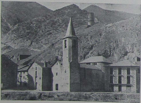
ESCALO. VISTA PARCIAL

Escaló es un pueblo típico del alto Pallars, situado a la orilla derecha del río Noguera Pallaresa, a unos 23 kms. de Sort. Estuvo fortificado en otro tiempo y conserva aún vestigios de tal carácter, tales como su portal de entrada y unas torres redondas. Su plaza es bella y típicamente porticada. A poca distancia del pueblo de Escaló se hallan las ruinas del antiguo Monasterio, posteriormente Priorato de San Pere del Burgal, notable construcción de estilo románico.