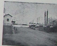
«Lo tomático. Valla conocida por su «tremenda eficacia» por todos los agricultores de la Partida. Hoy se vislumbra la posibilidad de salvarla a través de un pasadizo subterráneo.

Resulta más convincente elogiar sin tasa esa decisión que proclaman los agricultores de Nuestra Señora de Grenyana en la carroza que desfiló el día de