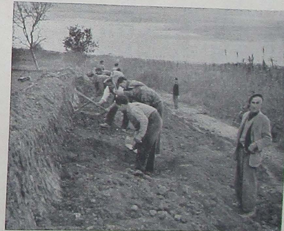
Dos nutridos grupos de obreros de la Partida, proporcionan la mano de obra necesaria para las reformas que se llevan a cabo a ritmo acelerado.

No ha sido el desprendimiento la tónica general de la payesía, moldeada en el crisol de la más recia austeridad, y por ello resulta mayormente plausible la táctica y el logro de