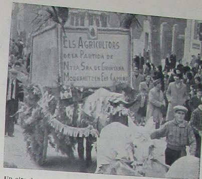
Un aire de renovación estrecheces los caminos de la huerta. Véase la carreta de los agricultores de Grenyana en el destile del día de San Antonio.

nalado de que una partida tan floreciente como la Grenyana carezca de escuela donde educar a la infancia, y de comunicación telefónica cuando anteriormente la tuvo, pero el hecho evidente nos conduciría por el terreno de la divagación estéril, y lo inle-