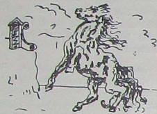
GIORGIO DE CHIRICO "Antes de la batalla"

Es poca cosa. Ha dormido en una postura parecida a los gatos, entre su abuela y yo, hasta el amanecer. Los demás no hemos podido dormir. El joven guardia civil del cuclío desabrochado se ha pasado la noche fumando. El hombre maduro leyendo una «novela del sábado» a la luz escasa y sucia de una de las bombillas; porque no sé qué pasa con la otra. Uno piensa que el hombre maduro de la eno-