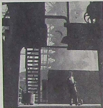
El Ruhr vuelve a ser una concentración industrial formidable. Su aportación ha de pesar decisivamente en la «Pequeña Europa».

Desde la revolución industrial inglesa de finales del pasado siglo, el principal problema de la industria no es la producción sino la venta de los productos. Todo el mundo sabe que los costes de producción se reducen en la medida que aumentan las cifras de producción. Pero estas cifras no pueden incrementarse si no se cuenta con un mercado lo suficientemente amplio para que pueda absorberlas. Europa ha tenido que arrastrar a este respecto, el lastre de sus comparti-