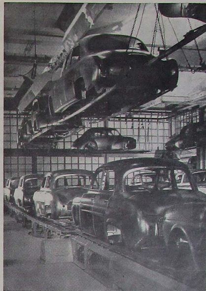
La industria automovilística europea, ingente, necesita ampliar sus mercados para abaratar sus costes de producción. He aquí la «cadena» de montaje de carrocerías del «Dauphine» en la fábrica Renault.

Recuérdese a este respecto que las enseñanzas recogidas del funcionamiento de la Comunidad Europea del Carbón y del Acero, demuestran que eran totalmente injustificados los temores franceses respecto a la inferioridad de la industria francesa para enfrentarse sin la protección de las barreras aduaneras con la pujante y dinámica industria alemana. La verdad sorprendente ha sido que los siderúrgicos franceses, espoleados por este estímulo maravilloso que es la competencia, han llegado a vender sus productos en el propio mercado alemán. La misma Italia, que a pesar de sus recientes progresos, es la nación menos industrializada de las componentes de la OEECA, se muestra altamente satisfecha de los resultados obtenidos de su participación en dicha Comunidad.