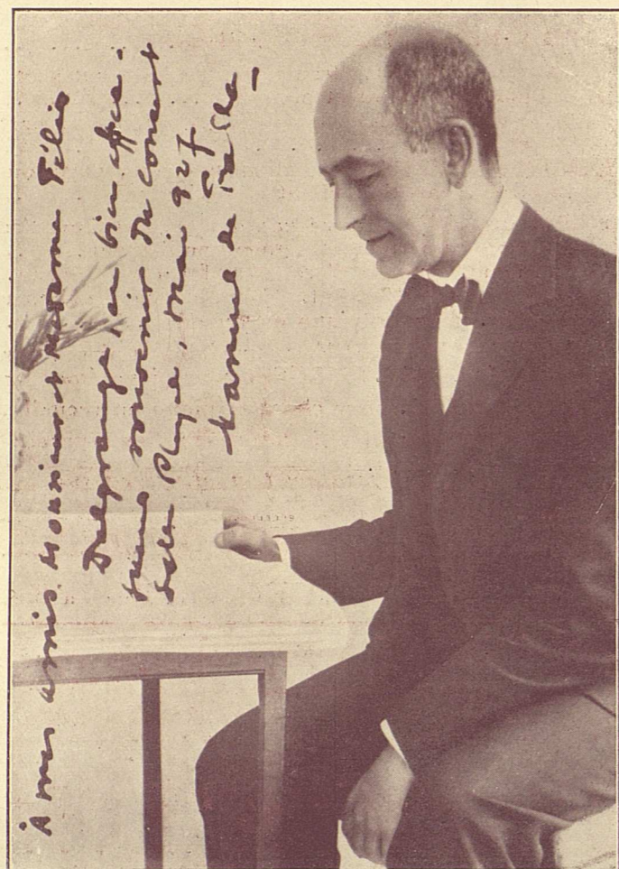
Edit. Max Eschig