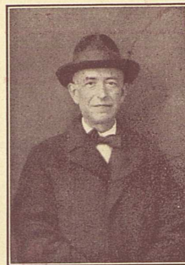
MANUEL DE FALLA

Fac-Similé de la Couverture de la R. I. M. D.