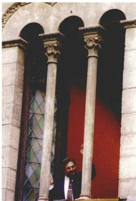
ANTONI SIURANA I ZARAGOZA Alcalde de Lleida