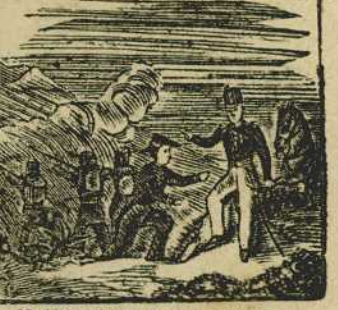
12 Al carlista ha sorprendido, pero en la dura refriega nuevamente salió herido.