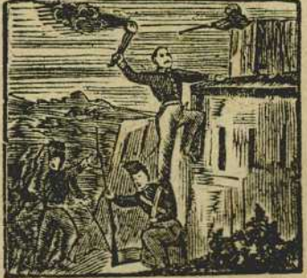
14 Un nuevo honor se corona pues aunque herido en el hombro entra el primero en Solsona.