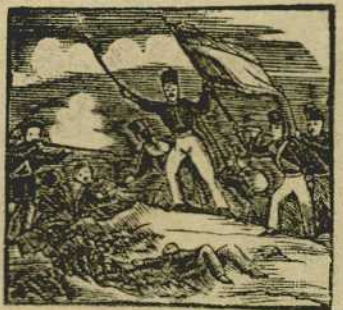
8 Tremolando una bandera vence a la faccion, que al varlo se amedrenta y desespera.