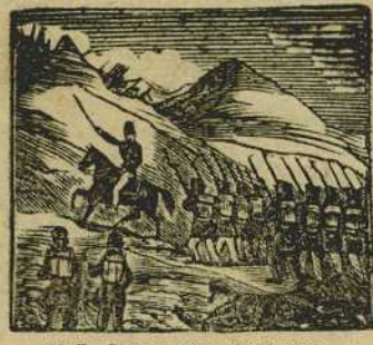
19 En Peracamps una a una va tomando posiciones al frente de la columna.