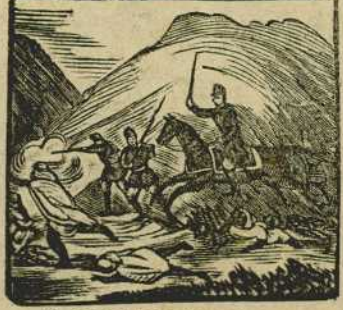
38 con valiente frenesí llena de oprobio y vergüenza al osado marroquí.