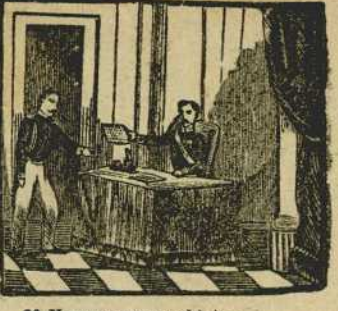
30 Narvaez por ambicion contra el ilustre guerrero espide auto de prison.