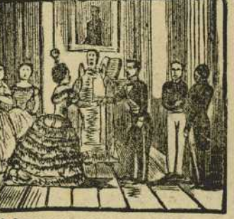
35 Despues que así se engalana con tanto honor, da su mano a una hermosa mejicana.