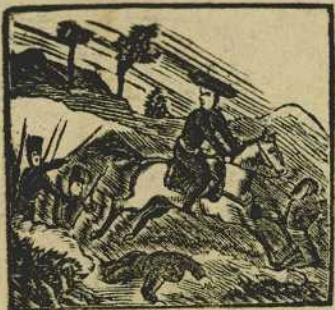
13 El valiente catalan pone en completa derrota al cabecilla Tristany.