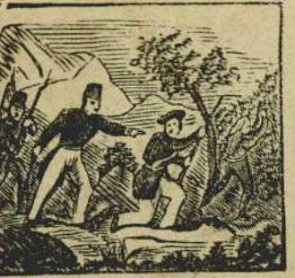
10 Nunca el miedo conocido, y a un faccioso aduanero por si mismo sujetó.