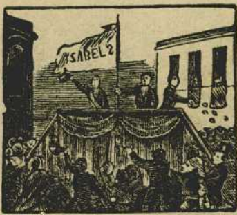
2 Quiere el pueblo libertad y a D. Isabel segunda proclama con lealtad.