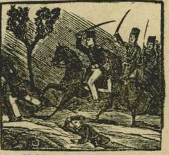
18 De su escolta a la cabeza, da pruebas mil en Biosca de valor y de firmeza.