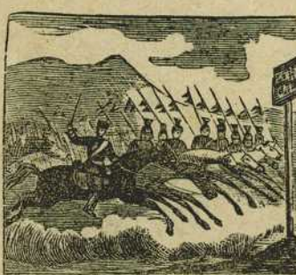
45 Al ver que no es secun tado se refugia en Portugal sin perder ni un soldado.