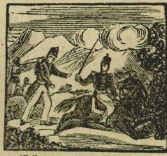
17 En vano vencerlo tratan pues no se inmuta en la lucha aunque el caballo le matan.