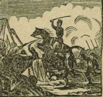
41 Con el tercio catalan, audaz salta las trincheras al frente de Tetuan.