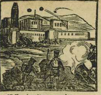
27 Un ejercito se emplea en apagar tanto ardor y a la villa bombardea.