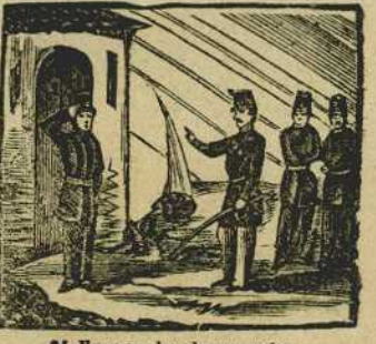
24 En prueba de su valor de fieros carabineros es declarado inspector