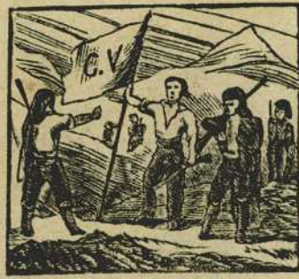
3 Varios mal aconsejados a Carlos quinto defienden entre montes y colladas.