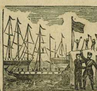
46 En Cadiz con gran teson Prim, Serrano y Topete hacen la revolucion.