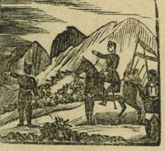
36 Por su indomable teson para ir a lidiar al Africa le ha elegido la nacion.