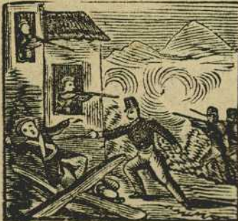
7 De nuevo al carlista abate y le echa de San Celoni tras un sangriento combate.