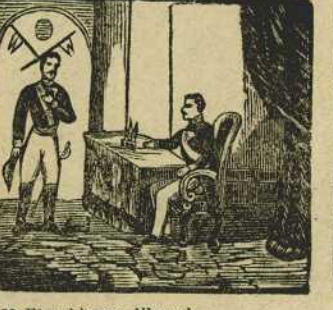
33 El gobierno liberal de Espartero, le dá el grado de teniente general.