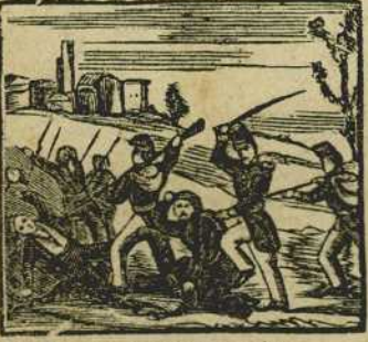
15 En otra sangrienta accion acudillando a los libres acuchilla a la faccion.