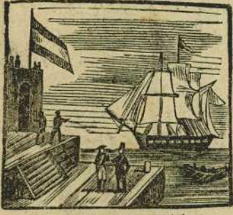
31 Un Ministerio imparcial, a la isla de Puerto-Rico le envia de general.