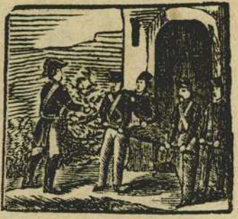
6 Por primera vez herido, el grado de subteniente con su honra merecido