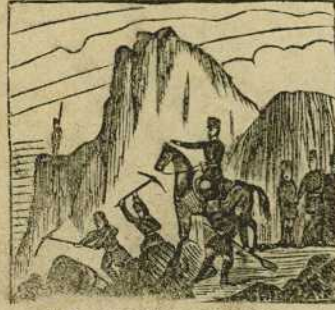
37 Pruebas de gran capitán ha dado, mandando abrir el camino de Tetuan.