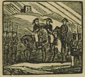
20 E invencible Espartero en los campos de Vergara da la paz al pueblo ibero.