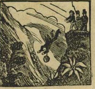
21 Es víctima de la saña de sus propios partidarios el cruel Carlos de España.