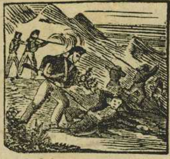
5 Cadete de voluntarios mata a un faccioso, y aterra con valor a sus contrarios.