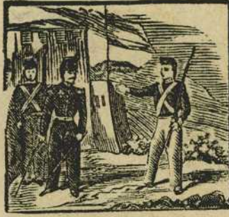
4 Prim, el heroe catalan, entre los libres se alista, a lidiar con noble afan.