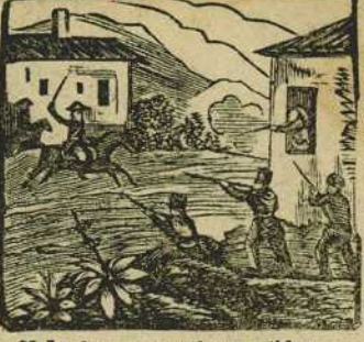
29 Luchan entrambos partidos para desgracia de España en mal hora divididos.