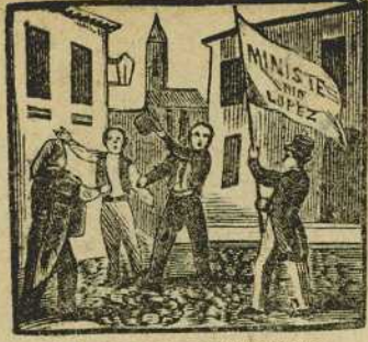
25 General pronunciamiento, de Lopez el gabinete reclama con atrevimiento.