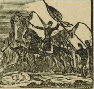
40 Empuñando la bandera, al marrueco en Castillejos amilana y de-espera.