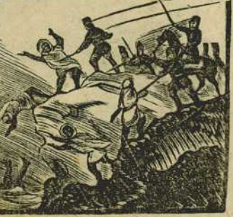
39 Adquiere nuevo blason cuando al ejército moro derrota en Cabo-negron.