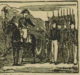
11 Su altivo valor premiando, su jefe le condecora con la cruz de San Fernando.