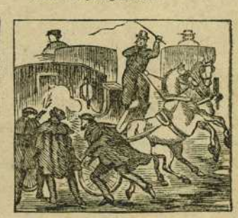
48 Y cuando ya consagrado al gobierno de la Nacion es vilmente asesinado.