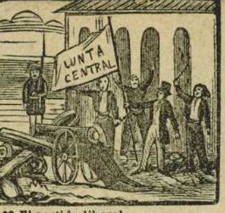
28 El partido liberal se divide, y Barcelona clama por Junta central.