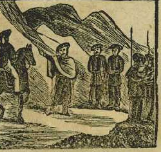
22 Los carlistas desfallecen y Cabrera y sus secuaces en la Francia se guarecen.