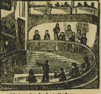
23 A más de batallador en el Congreso da pruebas de ser fogoso orador.