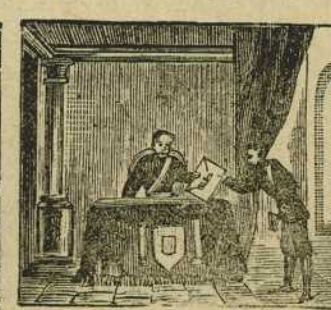
47 Por su gran valor y ciencia obtiene en el ministerio el sillon de presidencia.