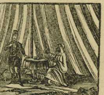
42 Con continente marcial O'Donell con Muley-Abbas firma la paz general.