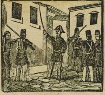
26 Prim en Reus se presenta y con sus sentidas frases a sus paisanos alienta.