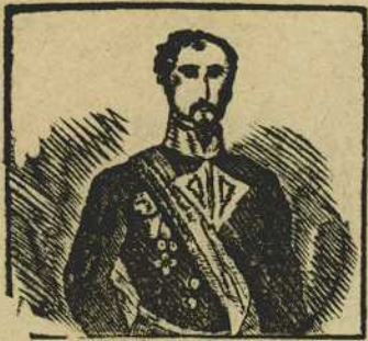
1 Repite el eco con gloria del general D. JUAN PRIM la grande y brillante historia