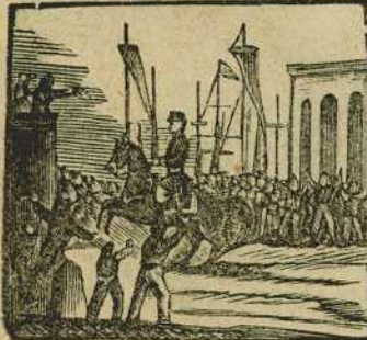
43 Prim, victorioso y triunfante, es por España aclamado al entrar en Alicante.