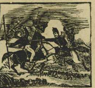
9 En la pelea el primero, acomete cuerpo a cuerpo a un enemigo lancero.