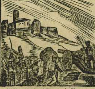
16 Mandando el baron de Meer se cubre de eterna gloria Prim, en el sitio de Ager.