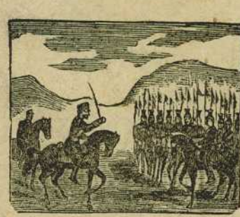
44 Por vencer la tiranía se subleva en Aranjuez Prim, con la caballería.