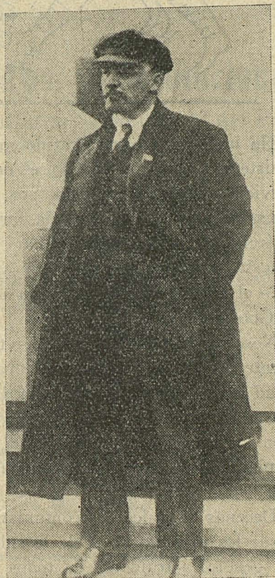
Lenin, artifice de la Revolución Rusa, maestro, guía y ejemplo del proletariado internacional

El Ejército Popular es la garantía de la victoria.