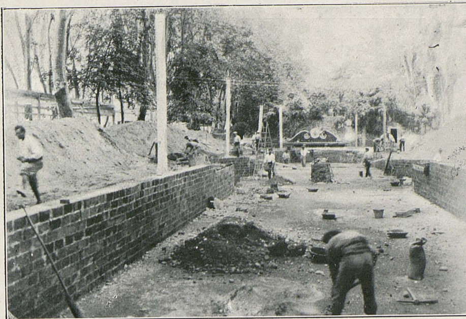
Construyendo la alberca para la Sección Hidráulica de la Exposición

Esta labor educadora, compete casi exclusivamente al maestro de escuela y este ha de darse cuenta de la trascendencia de su misión verdaderamente apostólica y sin duda la más alta que existe; ha de tener siempre presente que sin su cooperación se han de estrellar todos los esfuerzos del higienista y del legislador y ha de considerar como principal función de su cometido, no solo la