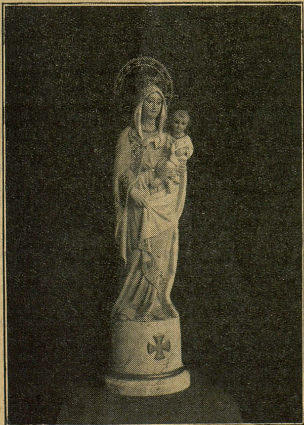
MAGNIFICA VIRGEN DEL PILAR ADQUIRIDA POR EL COLEGIO DE LÉRIDA Y BENDECIDA COMO LA BANDERA POR EL ILMO. SR. OBISPO EN LA FUNCIÓN RELIGIOSA DEL DÍA DOCE

Y obligados por último por los ensordecedores aplausos de la concurrencia hubieron de terciar también en los brindis nuestro querido Director, que pronunció un discurso emocionantísimo brindando por que pronto sean recogidas por las Alturas las justas reivindicaciones de la Clase; funcionarios del Estado y Escalafón, pues aun cuando muchos las creen difíciles son justas y todo lo que es justo más tarde o mas temprano se tiene que conseguir, por lo que hace votos para que esa consecución sea pronto, brindando por último por el primero y el más ejemplar de los españoles, S. M. el Rey, el más amante de las