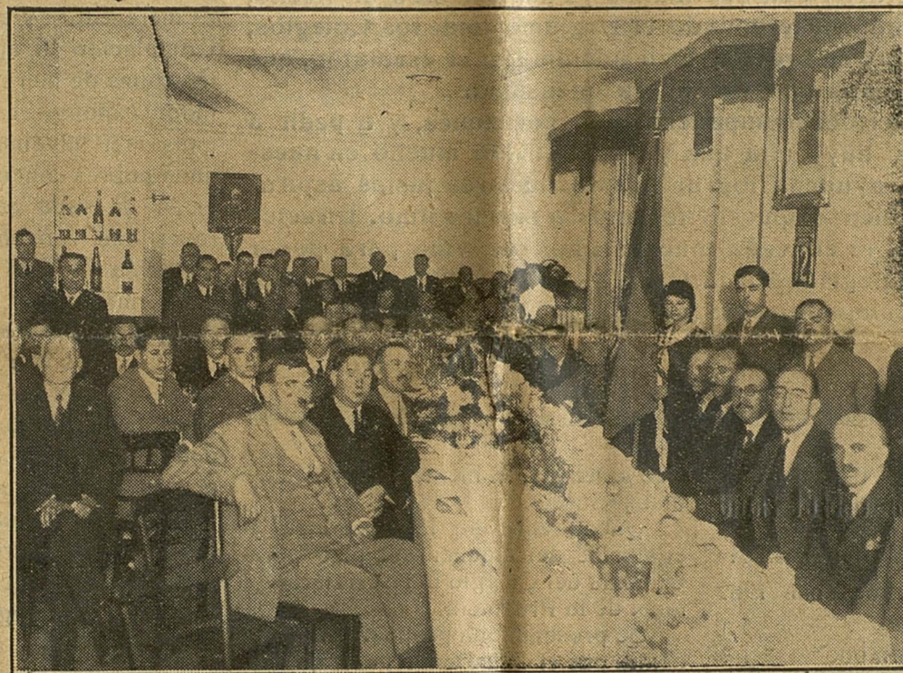
BRILLANTISIMO BANQUETE CELEBRADO EN EL HOTEL SUIZO DE LÉRIDA, CON ASISTENCIA DE REPRESENTACIÓN DE TODAS LAS AUTORIDADES PARA CONMEMORAR LA FIESTA DE LA PATRONA DEL SECRETARIADO

La misa fué a toda orquesta cantada por la Capilla de la Catedral y el sermón del ilustrísimo prebendado Dr. Cortecáns sencillamente elocuentísimo, cantando con la brillantez de frase e inspiradísimos conceptos en él característicos, todo el adorable misterio de la bella tradición de la