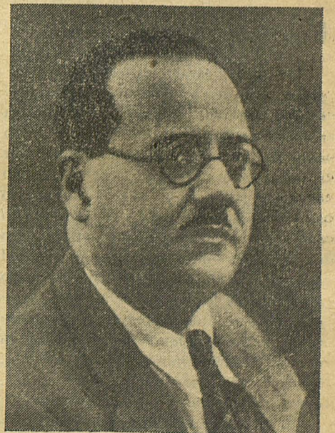
Presidente del Consejo de Ministros, Dr. Negrín

El arma de nuestros enemigos es el rumor y la calumnia; propalarlos es hacerles el juego.