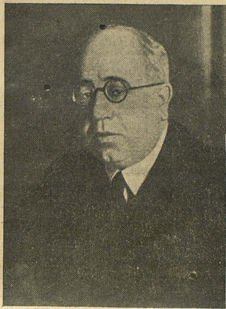
Excmo. Sr. Presidente de la República Española, D. Manuel Azaña y Díaz

Si, allí quedan hermanos nuestros, sometidos por la fuerza; con ellos mantendremos la relación precisa, para decirles que en un año de lucha hay dos mundos definidos claramente. Que aprovechen la mejor ocasión para pasarse con nosotros y limpiar juntos el suelo de España de asesinos, ladrones y traidores.