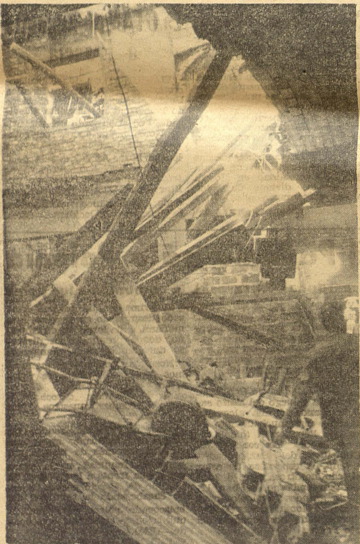
El hundimiento de la casa en construcción de la calle de San Cristóbal, puso nota de alarma en la ciudad. La noticia corrió a la velocidad del rayo todo el ámbito ciudadano. La expectación atrajo a muchos leridanos al lugar del suceso. Por suerte, únicamente resultó un obrero con lesiones de gravedad y otro de menor consideración, pero el derrumbamiento estuvo a punto de tener más trágicas consecuencias. De ahí que califiquemos la instantánea como la «Foto de la semana».