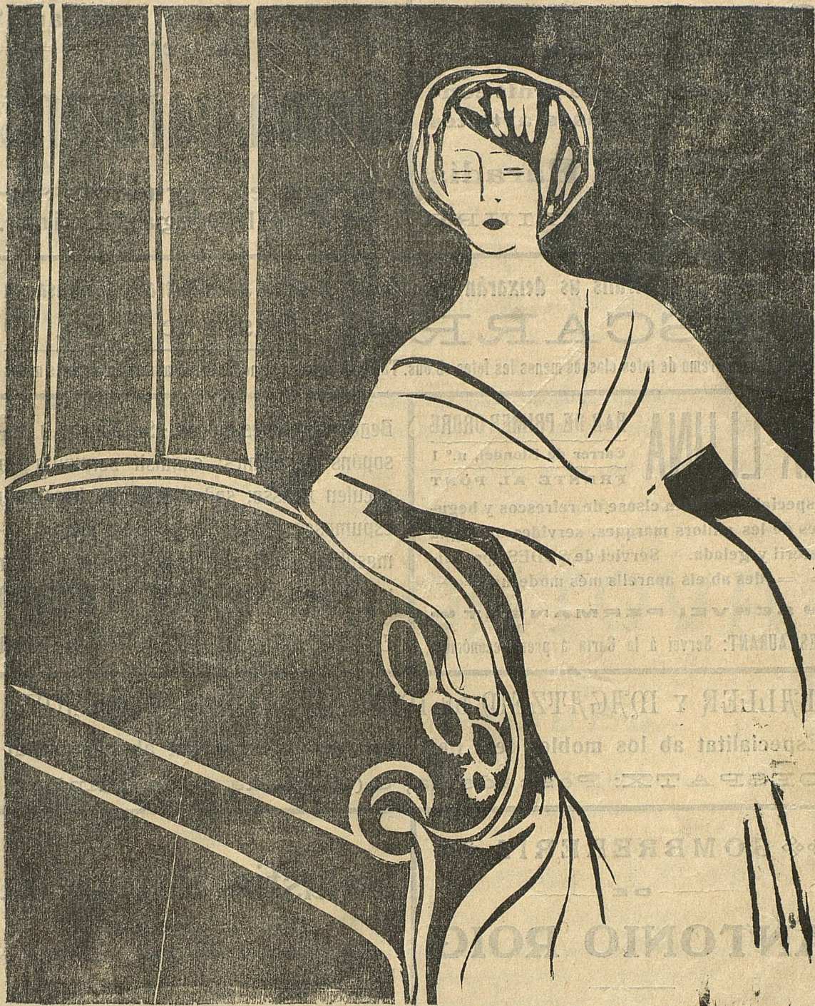
LA CARICATURA DE LA MELLER.

¡Miren que no poderli posar peresser massa llagar!