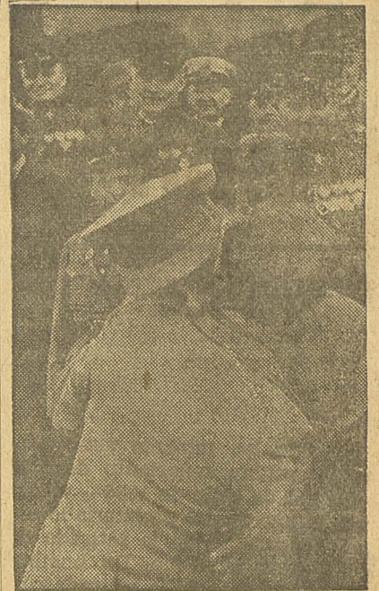
Stalin el jefe indiscutible del proletariado mundial abraza a un delegado español

Maiski, nuestro mejor valedor, casi diríamos nuestro único vale-