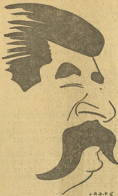
J. STALIN U. G. T.