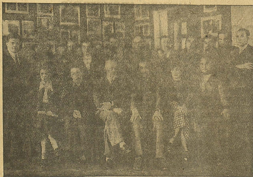
En el Museo de la Revolución

(De la carta del Buró Político del Partido Comunista a la Comisión Ejecutiva del Partido Socialista Obrero de España)