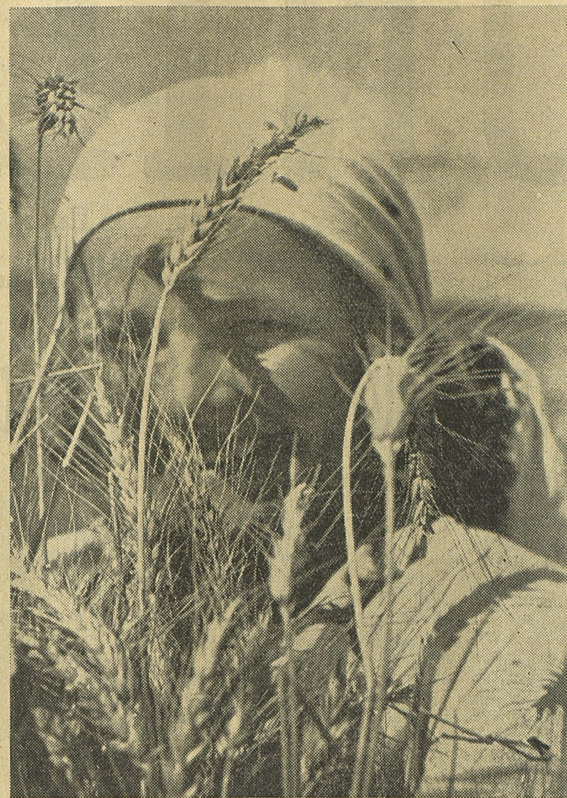
Esta joven, campesina del Koljós «Clara Zetkin» que nos muestra su fisonomía riante tras las hermosas espigas producto del fecundo sudor de los campesinos libres, es una imagen expresiva de la generación que avanza sin trabas por el camino del socialismo.

Mientras tanto la asamblea proclama su adhesión al Partido socialista y al Partido comunista, espe-