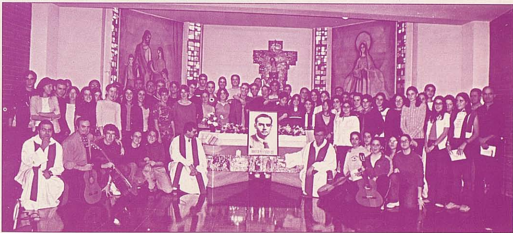
Els joves i celebrants amb la fotografia del Beat a la capella del Col·legi

Finalment es feu una crida a imitar-lo: "Agafem com a model a Francesc Castelló. No hem de renunciar mai al que creiem o volem. Tot té un preu. Cada cosa que fem ens costarà suor, treball, esforç i llàgrimes; però val la pena..."