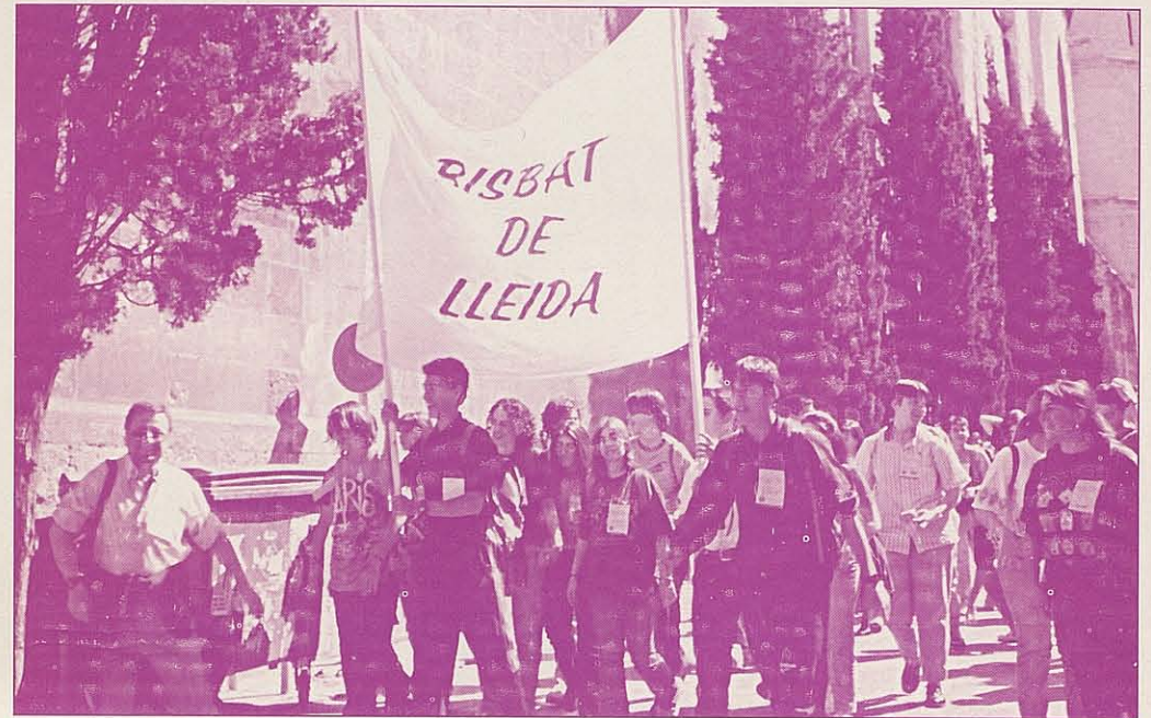
Els joves del Bisbat de Lleida seran presents a la XVII Jornada Mundial de la Joventut

sou la llum del món" es refereix a la santedat, com aquella llum que esclareix les tenebres i dóna sentit ple a la vida, tot fent un reflex de la glòria de Déu. És en aquest moment que el Papa cita en el seu missatge als joves als sants que han fet resplendir llurs virtuts heroiques davant el món, tot esdevenint –diu el Papa- models de vida que l'Església ha presentat amb vista a llur imitació per tots.