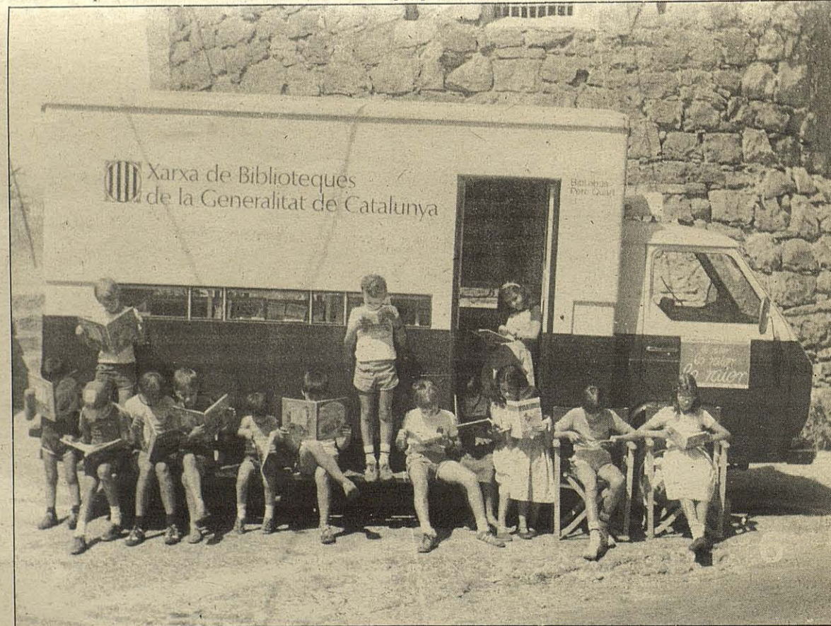
El bibliobús que està realitzant una gran feina cultural arreu de les nostres comarques.

I si el bibliobús i La Roda de Teatre de les Terres de Ponent, tenen ja un crèdit i l'aval del poble, hi ha un altre cicle en un altre aspecte cultural que ja està al cap damunt de la popularitat per als amants del cinema. La Filmoteca de la Generalitat de Catalunya, que tots els dilluns al cinema Bonaire, ofereix pel·lícules molt notable dintre d'un cicle. En aquest moment és el cicle modern que des de gener fins el març, acapara l'atenció dels amants del sèptim art. Fins al 16 de març, tots els dilluns aquest cicle amb pel·lícules, moltes d'elles inèdites a les nostres cartelleres i en altres autèntiques joies, d'una gran qualitat artística, poc comercials, però amb un ganxo extraordinari. Milers de lleidatanes segueixen aquest cicle cinematogràfic. Tot un aval.