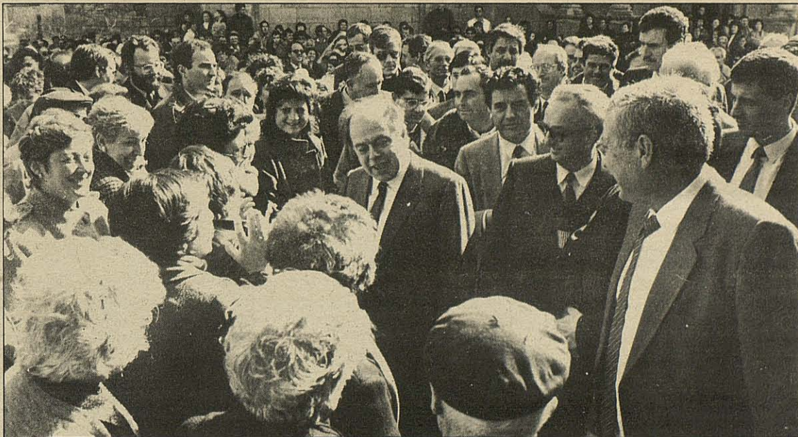
El Molt Honorable Jordi Pujol envoltat de la gent de Les Garrigues a la seva visita a Maials.

s'engegarà l'obra de portar aigua pel rec en una comarca de secà i al mateix temps que anunciava que estava en cartera l'estudi socio-econòmic que pogués millorar el nivell de vida