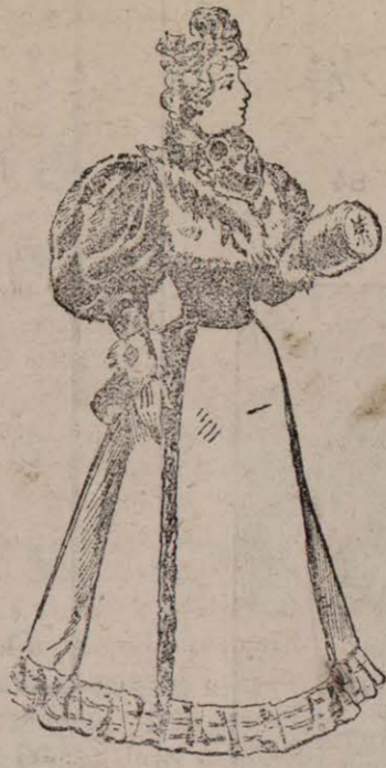
Traje de paseo

La falda completamente forrada se compone de cuatro diferentes paños, y se adorna en la base con un grande y rizado volante, y en la unión de los paños con grandes tiras de Astrakán.