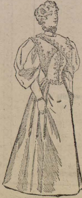
Traje de recepción

Materiales: 5 metros de paño sesgado, 6 metros de astrakan y 3'50 metros de piel de marta.