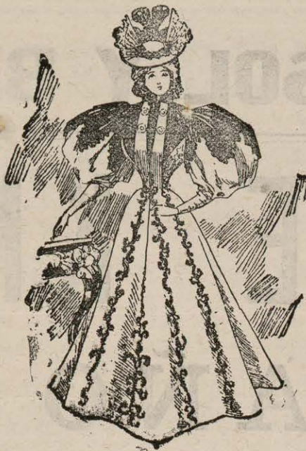
Traje de visita.

Para que armoniceis la elegancia con la economía, entendiendo que ese debe ser vuestro más ardiente deseo, sometemos á vuestra consideración, bellas lectoras, un modelo de vestido para visita que no deja nada que desear á la más exigente cultista de la moda.