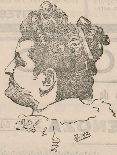
Doña Emilia Pardo Bazan

Antes de enterrarlas en la arena, es bueno envolverlas en un papel seda.