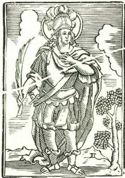
Boj de la colección Abadal

FERIAS Y FIESTAS DE LERIDA EN HONOR DE SAN ANASTASIO DEL 10 AL 15 DE MAYO DE 1949